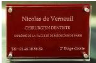
Bordeaux Profond ref : 613