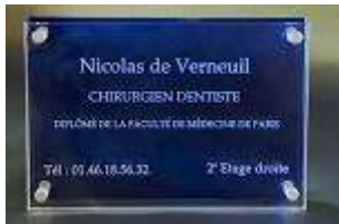
Bleu Outremer ref : 611