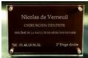
Marron Camel ref : 614