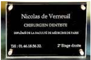
Noir Diamant ref : 612